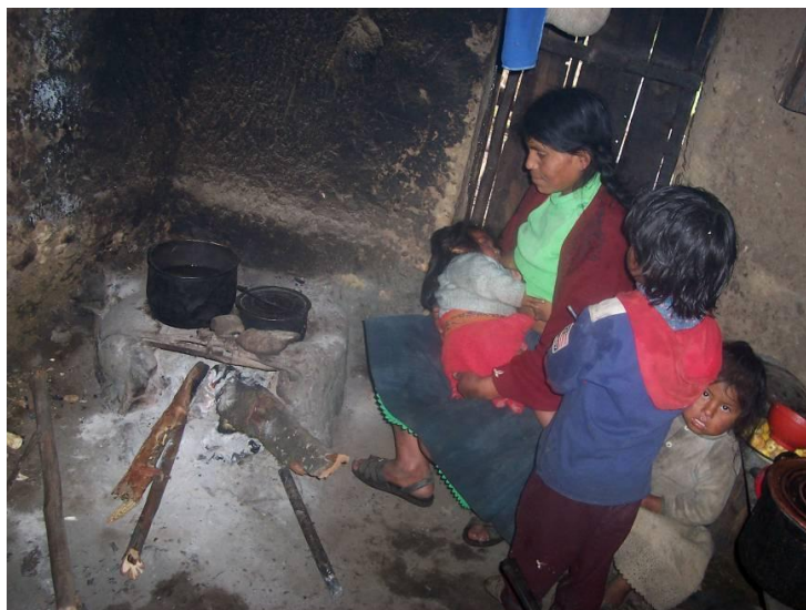
Een verschil van dag en nacht.

Minder gemakkelijk meetbaar, maar van groot belang voor het opzetten van kennisnetwerken, is de mate van sociale interactie in en tussen de verschillende dorpen. De uitvoering van het 1 e project 'Leren van de Besten' resulteerde in een belangrijke impuls: veel vaker dan in het verleden gaan families bij elkaar op bezoek om 'van de besten te leren'. Vertegenwoordigers van elk van de dorpen namen deel aan regionale en interregionale studiereizen. Tijdens de feestelijke bijeenkomsten, waarmee elk van de ongeveer 6 maanden durende wedstrijdseries werden afgerond, werden nieuwe contacten aangeknoopt en oude contacten verstevigd.